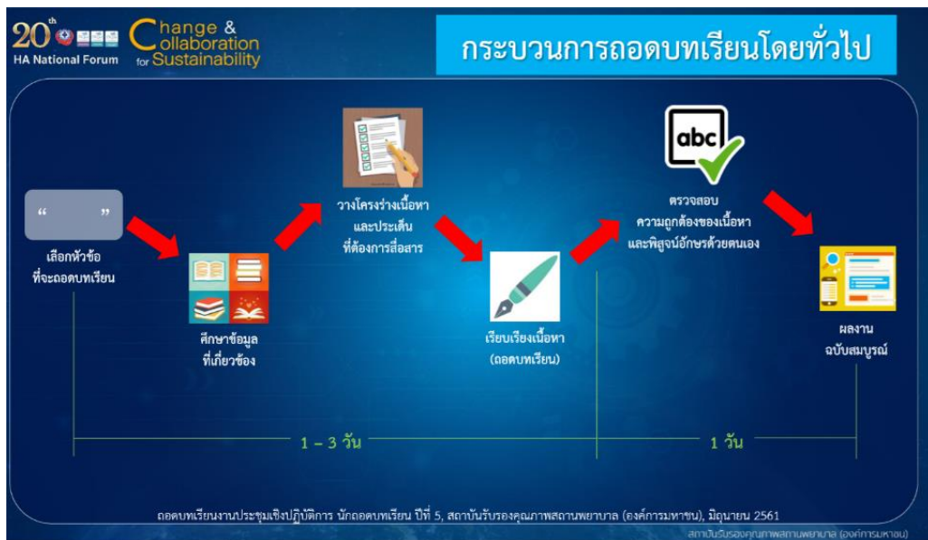
ภาพที่ 2 กระบวนการถอดบทเรียนโดยทั่วไป

และประเด็นที่ต้องการสื่อสาร จึงถอดบทเรียน เรียบเรียงเนื้อหา ขั้นตอนนี้ต้องอาศัยการฟังอย่างตั้งใจ สกัดความรู้ฝังลึก หากไม่เข้าใจประเด็นไหน ต้องหาความรู้และสอบถามจากวิทยากรเพื่อความถูกต้อง ขั้นตอนนี้ควรจะใช้เวลา 1-3 วัน แล้วทำการตรวจสอบโดยผู้ที่เกี่ยวข้องจนเป็นผลงานฉบับสมบูรณ์ (ภาพที่ 2) ขั้นตอนนี้ทุกอย่างควรแล้วเสร็จภายใน 1 สัปดาห์ โดยงานเขียนที่ดีควรจะเข้าถึงง่าย เข้าใจง่าย และง่ายต่อการอ่านของ Reviewers หรือ Editors