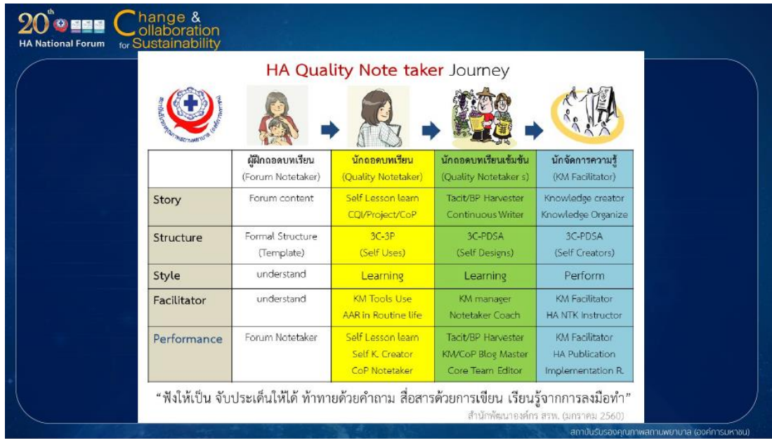
ภาพที่ 4 HA Quality Note taker Journey

นายสุทธิพงศ์ คงชุม กล่าวถึงเส้นทางการเป็นผู้ฝึกถอดบทเรียนสู่การเป็นนักจัดการความรู้ (ภาพที่ 4) เริ่มจากการเป็นผู้ฝึกถอดบทเรียนที่มีหน้าที่ถอดบทเรียนจากการประชุม หรือสัมมนา ในรูปแบบการเขียนที่เป็นทางการ โดยเข้าใจงานเขียนรูปแบบต่าง ๆ ได้ เมื่อฝึกฝนจนสามารถเป็นนักถอดบทเรียนได้แล้ว จะสามารถเรียนรู้ได้ด้วยตนเอง มีการพัฒนาคุณภาพอย่างต่อเนื่อง จะมีการนำหลักคิด 3C-3P มาใช้ มีการเรียนรู้เรื่องรูปแบบงานเขียนเพิ่มมากขึ้น และเริ่มมีการนำเครื่องมือ KM เช่น AAR มาใช้อย่างเป็นประจำ อีกทั้งยังมีหน้าที่เป็นผู้จัดบันทึกในกลุ่ม CoP ซึ่งสามารถสร้างความรู้ได้ด้วยตนเอง และพัฒนาตนเองให้เป็นนักถอดบทเรียนเข้มข้นได้ ในขั้นนี้ นักถอดบทเรียนจะมีความรู้ฝังลึกอยู่ในตนเอง สามารถพัฒนาโครงสร้างงานเขียนได้ด้วยตนเอง มีการนำหลักคิด 3C-PDCA มาใช้ สามารถเป็นครูฝึกการจดบันทึก เป็นตัวอย่างที่ดีในการจัดการความรู้ เป็นแกนหลักของกลุ่ม CoP และสามารถตรวจสอบงานเขียนได้ จากนั้นจึงพัฒนาตนเองสู่การจัดการความรู้ ซึ่งจะต้องเป็น Facilitator ด้านการจัดการความรู้ สามารถให้คำแนะนำด้านการพัฒนาคุณภาพ มีผลงานด้านการพัฒนาคุณภาพ สามารถสร้างความรู้ สร้างงานเขียนโดยมีโครงสร้างที่ประกอบไปด้วยหลักคิด 3C-PDCA ใช้รูปแบบต่าง ๆ ได้อย่างหลากหลาย จะเห็นได้ว่าในแต่ละขั้นต้องผ่านการฝึกฝนเรียนรู้อย่างต่อเนื่อง มีการใช้เครื่องมือ และหลักการที่ซับซ้อนขึ้น เรียนรู้จากการลงมือทำจนสามารถเป็นนักจัดการความรู้ได้ สุดท้ายนี้ นักถอดบทเรียนที่ดีจะต้อง “พึงให้เป็น จับประเด็นให้ได้ ทำทหายด้วยคำถาม สื่อสารด้วยการเขียน เรียนรู้จากการลงมือทำ”