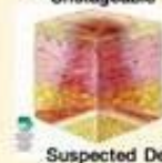
Suspected Deep Tissue Injury

บริเวณที่ผิวหนังยังคงปกคลุมอยู่ไม่มีการฉีกขาดแต่มีการเปลี่ยนสีเป็นสีม่วงคล้ำหรือสีแดง หรือมีตุ่มเลือดที่เกิดจากกล้ามเนื้อใต้บริเวณนั้นได้รับแรงกดทับ